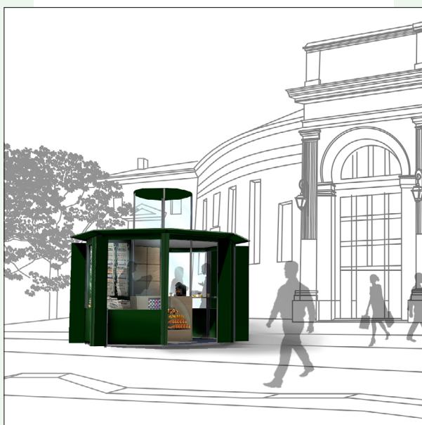
«Le temps d'un kiosque»